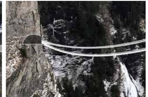
Kaverne: Abenteuer und Erholungsinsel im Fels.