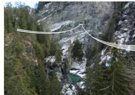
Zwei Brücken-Etappen: 120m und 240m.

LAGE Das Gebiet Solisbrücke ist als Tor bzw. Eingang ins Albulatal und zum schweizweit grössten regionalen Naturpark Parc Ela bekannt und gilt neben seiner historischen Relevanz als wichtiger Verkehrsknoten im Herzen Graubündens. Mehr als hundert Jahre Baugeschichte und Ingenieurskunst versammeln sich hier in Form von imposanten Infrastrukturen am Eingang der ebenso beeindruckenden Schynschlucht. Der Solisviadukt gehört zum UNESCO Welterbe Rhätische Bahn. Als höchster Viadukt hat er auch die grösste Spannweite auf der Albulalinie. Neben dem Solisviadukt spannt sich die kleine Steinbrücke über die schmale Schynschlucht, in der in 89 Meter Tiefe die Albula fliesst.