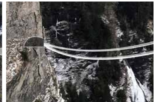
Kaverne: Abenteuer und Erholungsinsel im Fels.